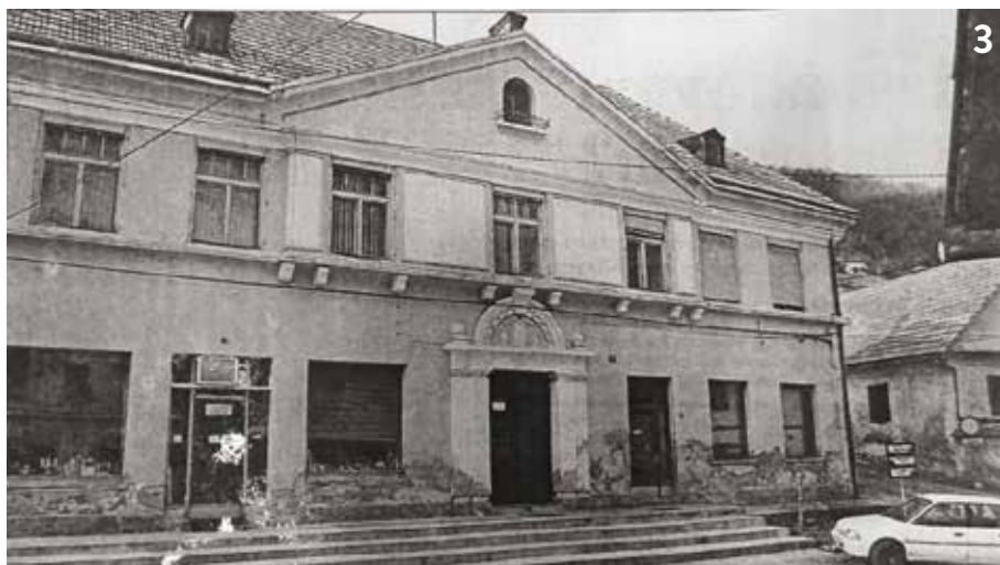
Slika 3. Knjižno izposojevališče v prostorih krajevnega urada (1976)