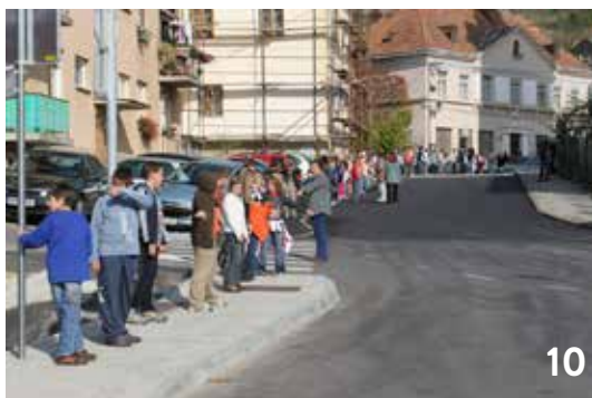
Slika 6. Novi prostori v Kulturnem centru (2008)