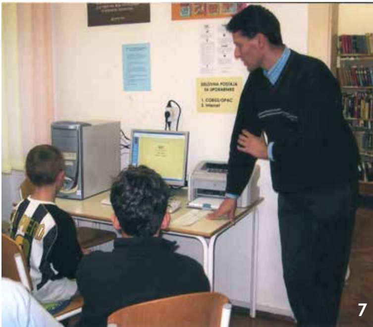
Slika 10. Kulturni dom Jožeta Mihelčiča (1994)