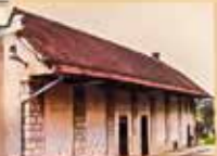
KULTURNI DOM JOŽEFA MIHELČICA SRMIČ