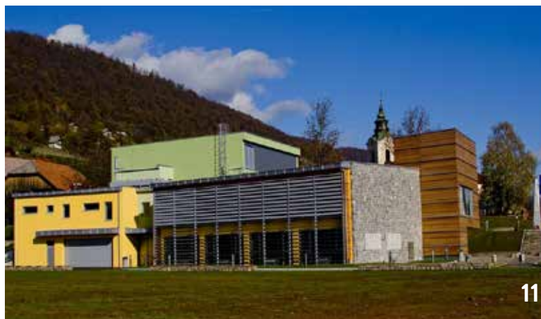
Slika 9. Novi Kulturni center v Semiču (2008)