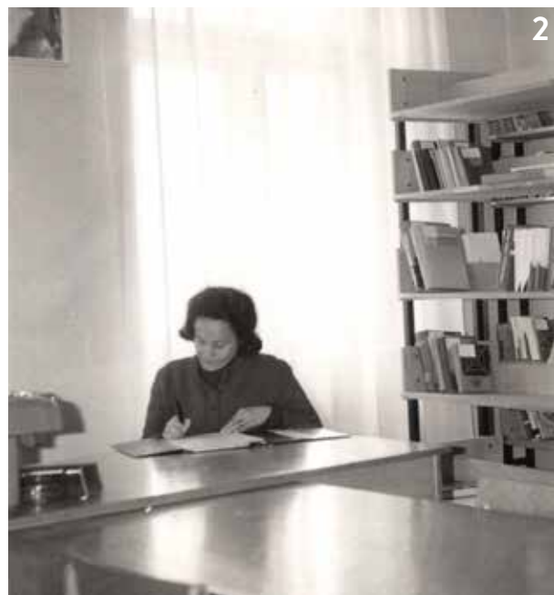
Slika 1. Semič v Beli krajini - J. Dular (okoli 1900)