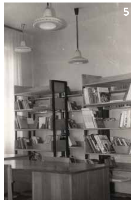
Slika 5. Knjižno izposojevališče (1976)